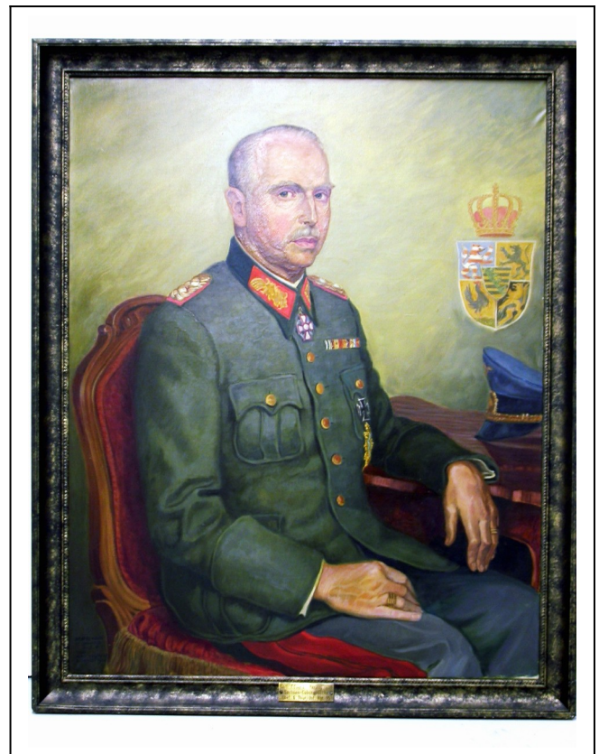
Kat. 13 Herzog Carl Eduard in Generalsuniform, 1934